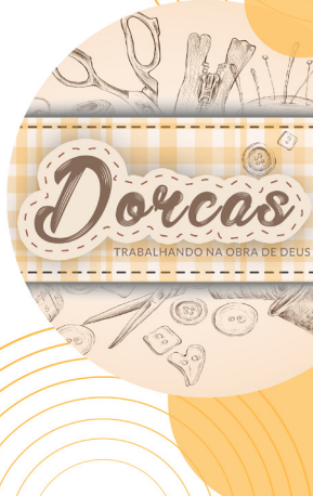
Foto Encerramento Dorcas

O Grupo Dorcas convida toda a igreja para a exposição de seus artesanatos, no dia 8 de dezembro , no Café Ipic, com muitas novidades. Venha prestigiar o trabalho do grupo. O valor arrecadado na exposição será repassado para o Núcleo Canaã Saúde.